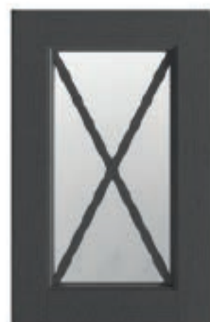
TINTO GRIGIO ANTRACITE DECAPÈ 23 Stained pickled charcoal grey Tinto gris antracita decapè Tinté gris anthracite décapé Anthrazitgrau Decapè Окрашенный серый антрацит decapè