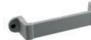
SYENE Argento antico - Ancient silver - Plata antigua - Argent ancien - Antiker Silber - Старинное серебро

Interasse - Handle Center pull - Paso Entraxe - Achsabstand - Межосеовое расстояние 96 mm