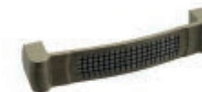
LERICI Ottone antico - Ancient brass - Latón antiguo - Laiton ancien - Antiker messing - Античная латунь

Interasse - Handle Center pull - Paso Entraxe - Achsabstand - Межосеовое расстояние 96 mm