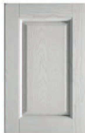
BIANCO GHIACCIO DECAPÈ LA Pickled ice white Blanco hielo decapè Blanc glace décapé Eisweiss Decapè Белый лёд decapè