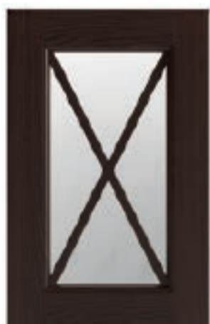
TINTO NOCE 07 Stain walnut Tinto nogal Tinté noyer Nussbaum gefärbt Отделка орех

GLASS DOORS - PUERTAS VIDRIO - PORTES VITREES - GLASFRONTEN - ДВЕРКИ СО СТЕКЛОМ