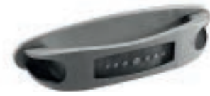
IMPERIALE Argento anticato - Ancient silver - Plata antigua - Argent ancien - Antiker Silber - Старинное серебро

HANDLES - TIRADORES - POIGNEES - GRIFF - РУЧКИ