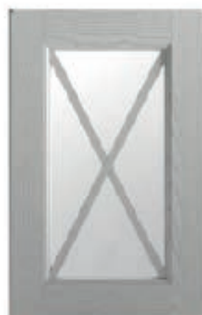
BIANCO GHIACCIO DECAPÈ LA Pickled ice white Blanco hielo decapè Blanc glace décapé Eisweiss Decapè Белый лёд decapè