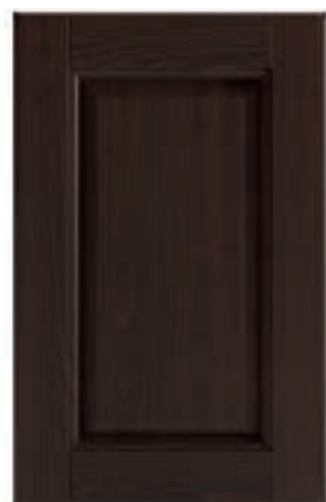
TINTO NOCE 07 Stain walnut Tinto nogal Tinté noyer Nussbaum gefärbt Отделка орех

WOOD DOORS - PUERTAS MADERA - PORTES BOIS - FRONTEN HOLZ - ДВЕРКИ В ОТДЕЛКЕ ДЕРЕВО