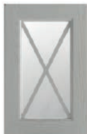
TINTO CORDA DECAPÈ 33 Stained pickled rope Tinto cuerda decapè Tinté corde décapé Seilfarbe Decapè Окрашенная пенька decapè