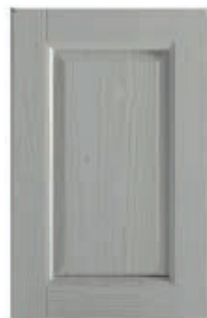
TINTO CORDA DECAPÈ 33 Stained pickled rope Tinto cuerda decapè Tinté corde décapé Seilfarbe Decapè Окрашенная пенька decapè