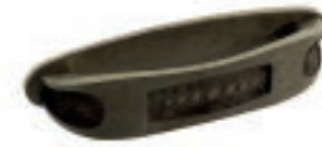
IMPERIALE Ottone antico - Ancient brass - Latón antiguo - Laiton ancien - Antiker messing - Античная латунь

Interasse - Handle Center pull - Paso Entraxe - Achsabstand - Межосеовое расстояние 96 mm