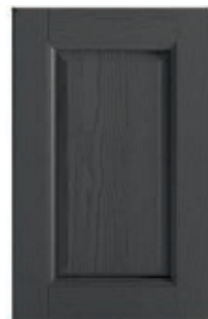
TINTO GRIGIO ANTRACITE DECAPÈ 23 Stained pickled charcoal grey Tinto gris antracita decapè Tinté gris anthracite décapé Anthrazitgrau Decapè Окрашенный серый антрацит decapè