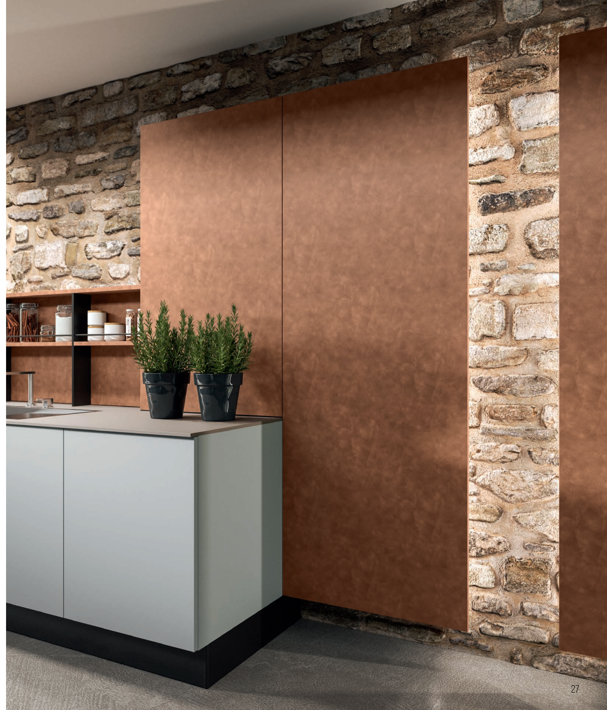
ШКАФЫ И СТЕНОВЫЕ ПАНЕЛИ BROWN LARCH.