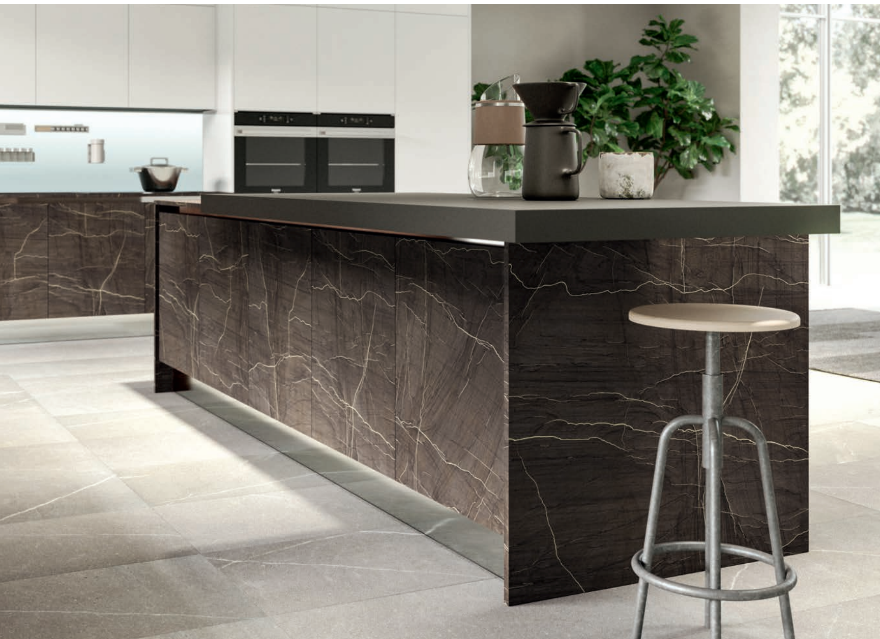
PIANO SNACK AGGETTANTE IN FENIX NTM GRIGIO BROMO.

PROTRUDING SNACK TOP IN FENIX NTM GRIGIO BROMO.