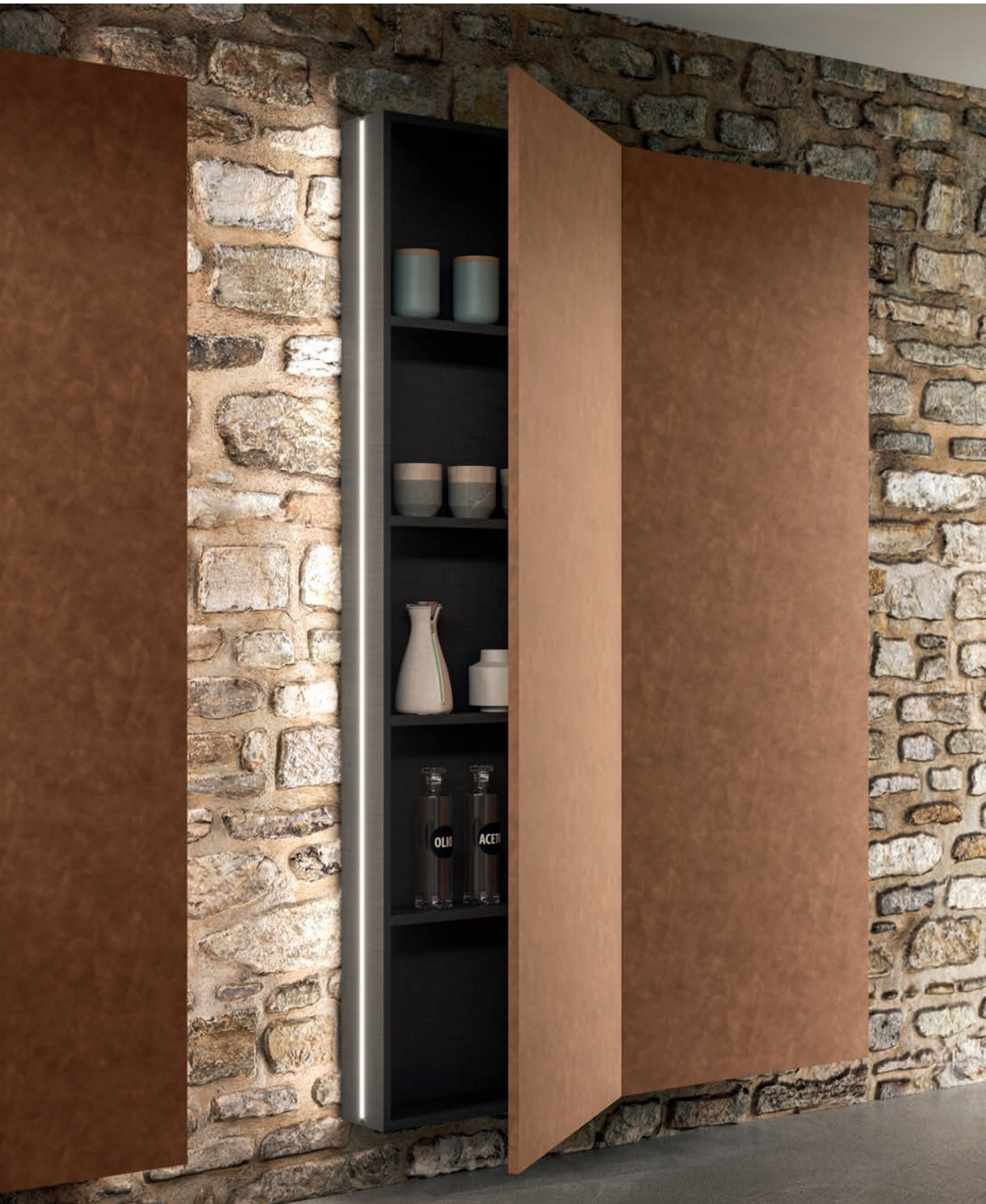
COLONNE E SCHIENALI BROWN LARCH.